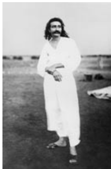
חלל ללמוד לאהוב את אלוהים באהבת אלו שאותם אינך מסוגל לאהוב