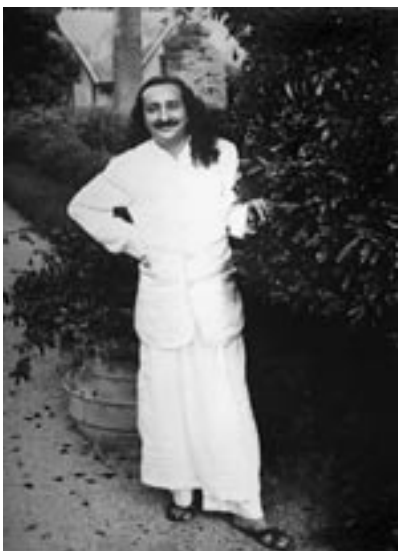
למרות כל ההסברים וקריאת ספרים מלים הן רק מלים. רק אהבת אלוהים מחוללת את פלא הפלאים.