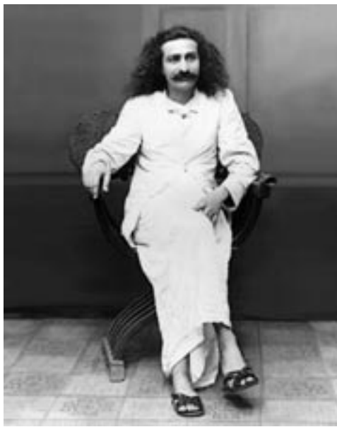
אלוהים הינו האני העליון הפנימי שלך. אל תבקש אחר האלוהים מחוצה לך.