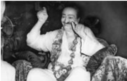
על תכעס על מי שמרכל עליך, אלא היה שבע רצון; משום שכך הוא משרת אותך כשהוא מפחית את עומס הרשמים המשעבדים שליך; רחם עליו משום שכך הוא מגדיל את משא הרשמים המשעבדים שלו.