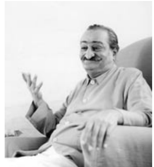
האנוכיות של כולם היא מקור הייסורים הבלתי פוסקים.