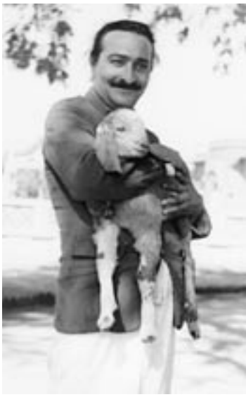
אהבה הינה טהורה כאלוהים. היא מעניקה ולעולם אינה מקשה