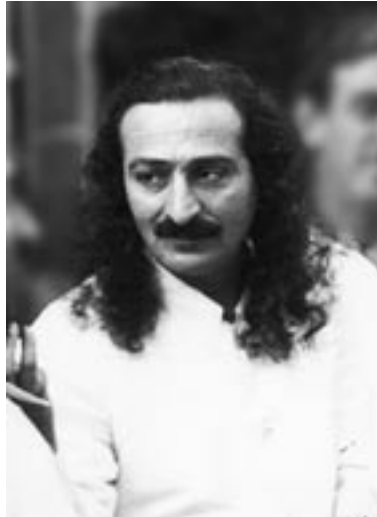
חקוק את הדברים האלו על לוח לבך: אין שום דבר ממשי פרט לאלוהים. אין חשיבות לדבר פרט לאהבת האלוהים.