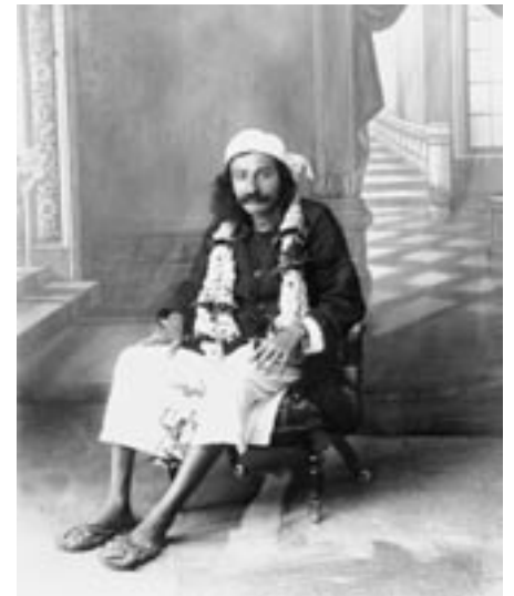
מקור האושר העליון הנצחי הינו האני האלוהי השוכן בכלם